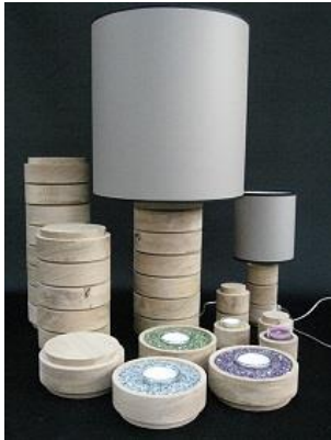
Een urn als lamp

De as van uw dierbare verstrooien op zee behoort ook tot de mogelijkheden.